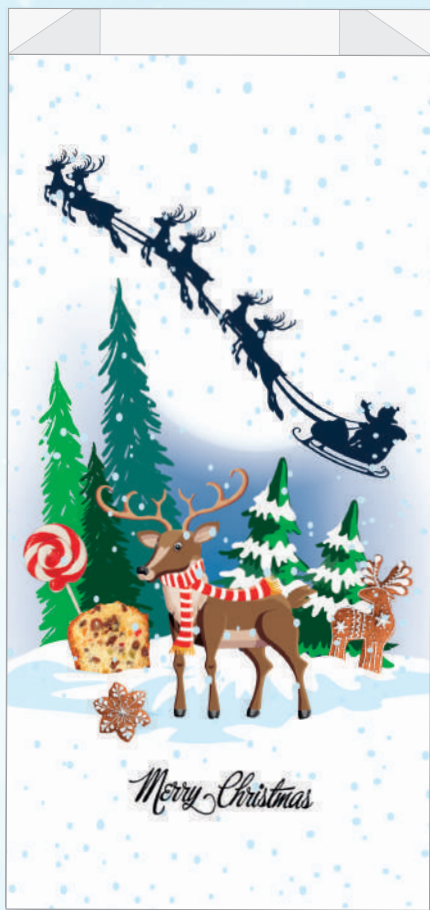
cm. 22 x 44