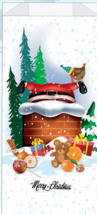
cm. 17 x 35