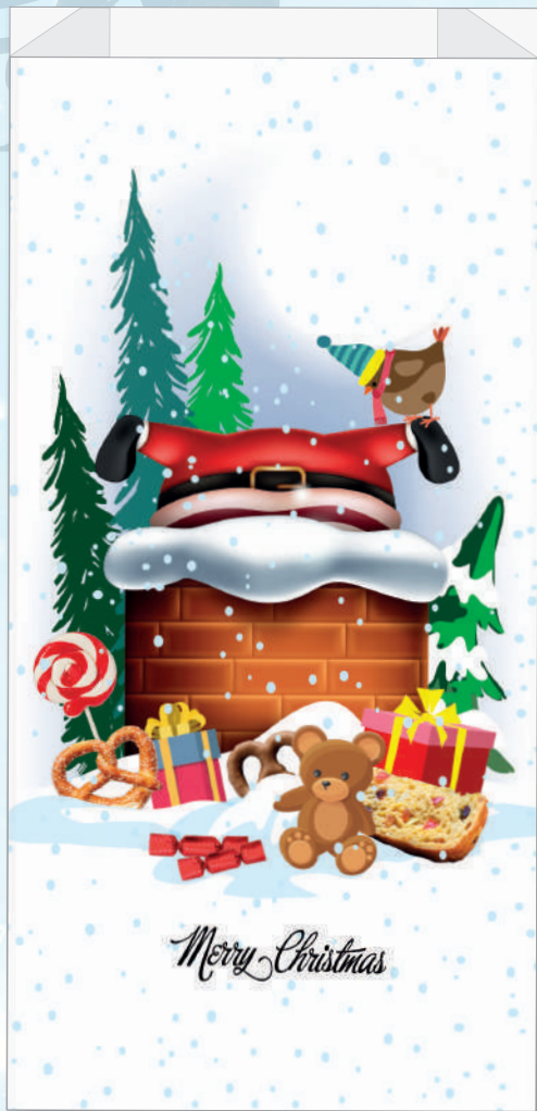
cm. 25 x 50